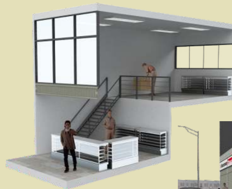
Local con mezzanine y con vista a la calle TIPO 2