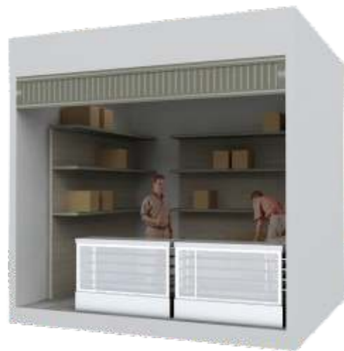
Local interior en semisótano TIPO 1

Adicionalmente, se cuenta con locales que no tienen los depósitos integrados sino más bien ubicados en un área destinada a depósitos, donde podrán elegir aquellos con las áreas según su necesidad.