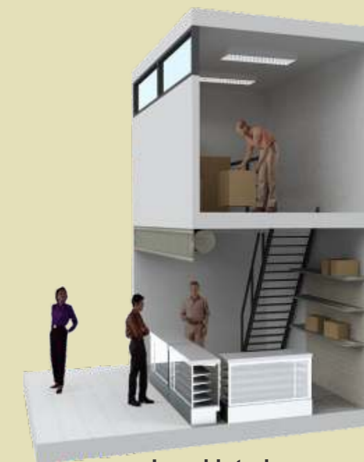
Local interior con depósito TIPO 4