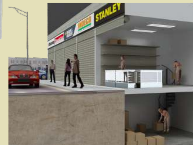
Local exterior con depósito en sótano TIPO 3